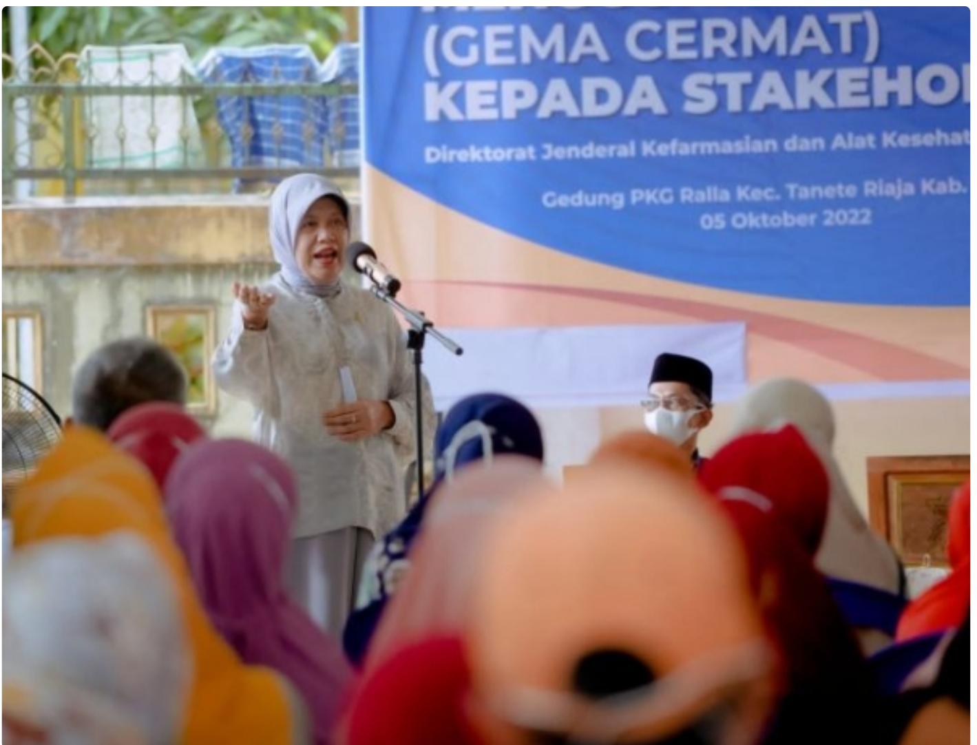
Anggota DPR RI, drg. Hj. Hasnah Syam, MARS

BARRU- Sosialisasi Gerakan Masyarakat Menggunakan Obat (Gema Cermat) dan Optimalisasi dalam rangka mendukung Germas Oleh Anggota Komisi IX dan Kementerian Kesehatan Republik Indonesia (Kemenkes RI).